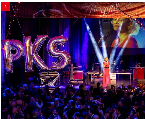
Foto: 1) Ples skupiny firem PKS, 2) Setkání s autorizovanými prodejci ve sportovním duchu, 3) Nohejbalový turnaj zaměstnanců, 4) Exkurze Felicia-coupe klub u jedné z našich výrobních hal, 5) Rozsvícení vánočního stromu PKS, 6) Vánoční večírky v restauraci INGOT

V průběhu roku 2023 proběhlo v rámci naší firmy několik zajímavých akcí. Některé z nich jsme při jejich průběhu nafotili a nyní Vám je můžeme krátce připomenout.