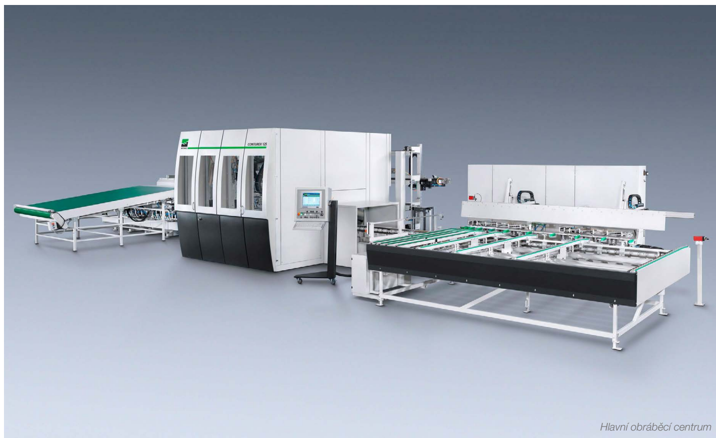
Hlavní obráběcí centrum

V rámci nákupu nové technologie pro naši divizi Eurookna jsme v květnu uzavřeli výběrové řízení na dodávku hlavního operačního centra. Tento stroj je nakonfigurován v nejvyšší řadě samostatně stojícího v tomto provedení. Dále už výrobce tyto stroje seskupuje do podélných sestav, ale to už je otázka jiných kapacit, výrobních prostor a samozřejmě také ceny. Celý výběr byl velmi složitý i s ohledem na krátký čas na zvážení všech „pro a proti“ – nakonec jsme však úspěšně vybrali to neoptimálnější zařízení pro naše potřeby.