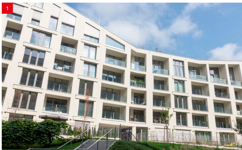
Foto: 1) PORT Karolina, 2) Zahálka Modřany, 3) Prosek PARK, 4) Terasy Strašnice, 5) Střížkov Plazza, 6) Terasy Břevnov

Náš dlouholetý firemní slogan „Okna prověřená Vysočinou“ odkazuje na lokalitu kraje Vysočina, kde máme sídlo firmy a největší výrobní kapacity. Už mnoho let je pravdou, že krásné a významné projekty s našimi okny najdete i v našem hlavní městě – v Praze. Namátkou vybíráme některé bytové projekty z poslední doby.